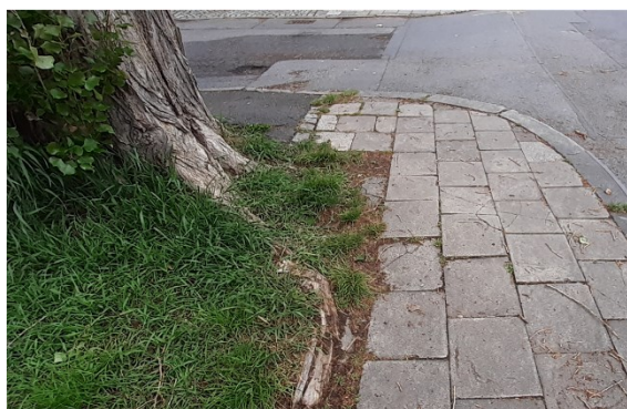
Obrázky 1 až 5, topol černý var. Italica , u opravovaného chodníku na rozcestí ul. Máchova a Seifertova (fotodokumentace pořízená při ohledání na místě)

Informace o záměru dle předložené projektové dokumentace doplněné o opatření na ochranu dřeviny druh topol černý var. Italica na p.č. 2343 v k.ú. Krnov-Horní Předměstí